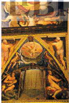
Luați la dumneavoastră un binoclu, pentru a putea admira plafonul bibliotecii El Escorial

Published by AA Publishing, a trading name of Automobile Association Developments Limited, whose registered office is Fanum House, Basing View, Basingstoke, Hampshire RG21 4EA. Registered number 1878835.