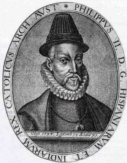
Felipe al II-lea și-a stabilit capitala la Madrid în 1561