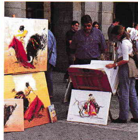
„Vânătăoare” de suveniruri în Plaza Mayor