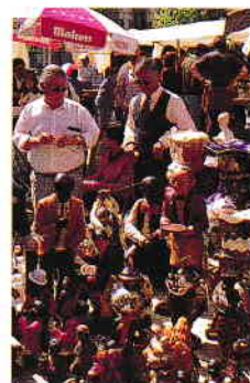
Târgul Rastro este o tradiție duminicală